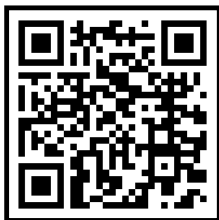
Puer Natus in Bethlehem